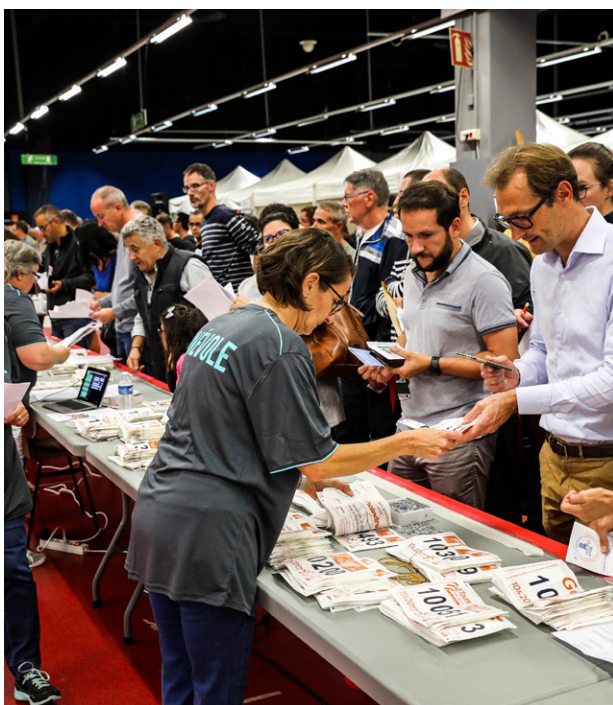
Les clubs d'athlétisme de Tours sont présents sur l'organisation.

L'organisation de l'évènement peut s'appuyer sur les compétences et la disponibilité des trois clubs d'athlétisme que compte la ville de Tours. L'A3 Tours, l'ASPTT Tours et Jogg'In Tours seront encore d'une aide précieuse.